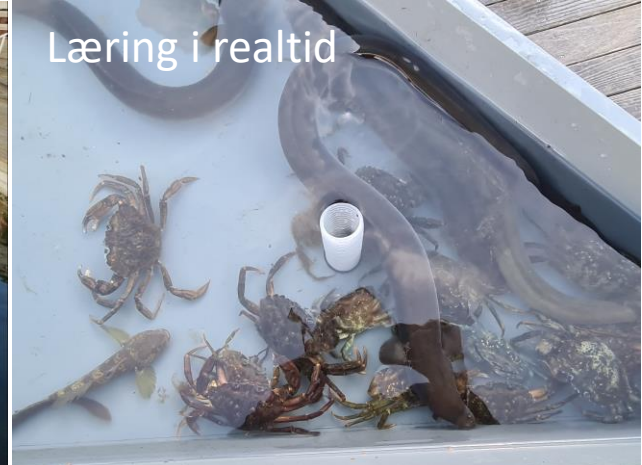
Læring i realtid

Med naturvidenskab bliver vi nysgerrige og undersøgende. Et bærende element i undervisningen.