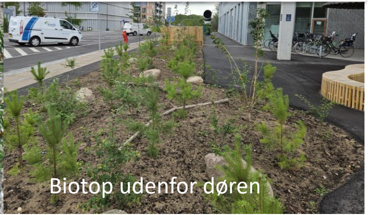
Biotop udenfor døren