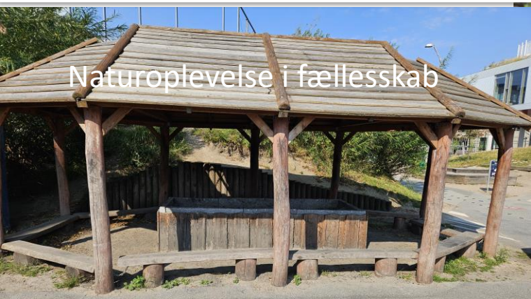
Naturoplevelse i fællesskab

Grundlag i mange fag, der kan udnytte skolens fysiske rammer.